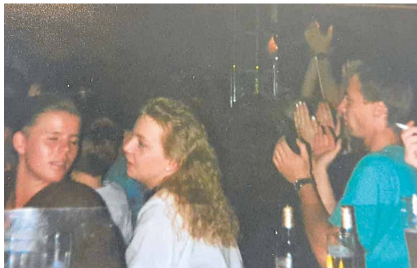
In den 80er Jahren schafft der Keller den Sprung, sich mit wechselnden DJ's zu einer Art Disco zu entwickeln.